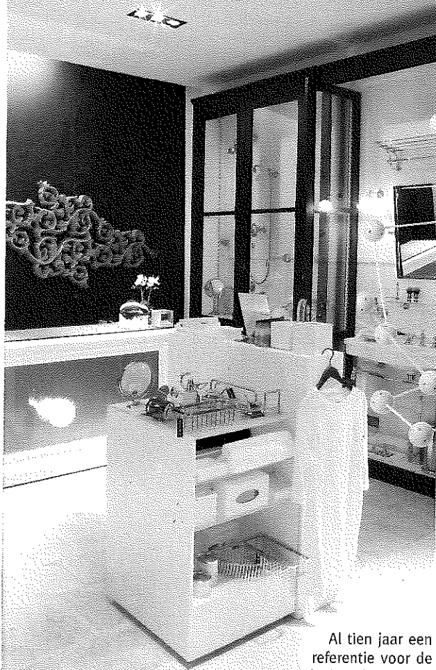
Al tien jaar een referentie voor de exclusieve badkamer.

Weekend Knude Made Special Zomer 2007 21 feb.